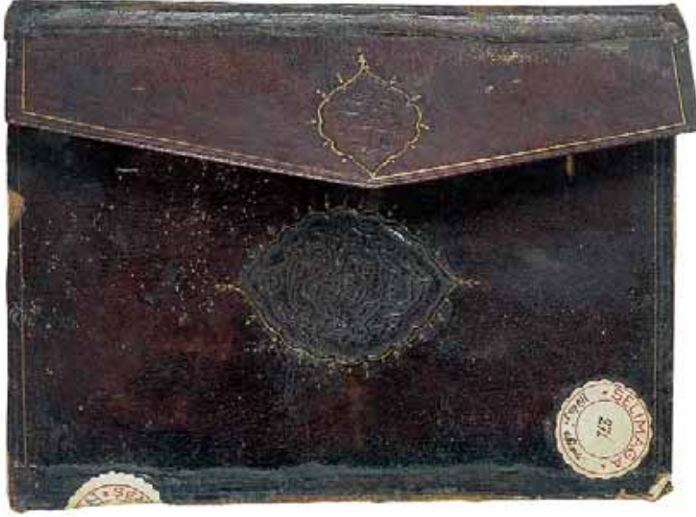
Aziz Mahmud Hüdâyî'nin bir eserinin cildi

Semnûn sevgiden söz edince mescidin lambalarının kırıldığı rivâyet olunur. İbrahim b. Fâtik şöyle demiştir: Semnûn'un sevgiden söz ettiğini işittim. Derken yanına küçük bir kuş geldi. Ona yaklaştıkça yaklaştı ve önünde durdu. Sonra kan gelinceye kadar gagasıyla toprağa vurdu ve öldü.